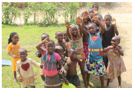
Bygatan i Mimia med barn som hälsar till oss!

På den gata vi bor finns människor från ”alla folkslag och stammar”. Equmeniakyrkans internationella arbete utspelar sig på denna gata! Den genomlysning av den internationella missionen som gjorts är en av punkterna på agendan för Kyrkokonferensen i år. Beslut skall tas gällande framtiden och vårt gemensamma uppdrag! Det är en stor fråga, som också har inflytande på vårt arbete i Sverige. Men främst har den betydelse för människor i andra länder.